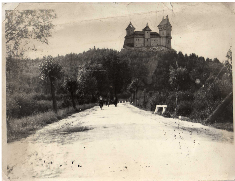
Fot. 3. Fotomontaż autorstwa Piotra Śpiewli: widok na wzgórze Zamczysko z doklejonym rysunkiem zembrzyckiego zamku wykonanym przez autora