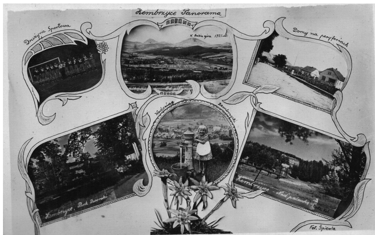
Fot. 5. Zdjęcie projektu pocztówki „Zembrzyce Panorama” autorstwa Piotra Śpiewły, wykonanej techniką kolażu, lata 30. XX w. (Od lewej, zgodnie z ruchem wskazówek zegara: Zembrzyce – Park Dworski, Drużyna Sportowa, Zembrzyce od północy [z zaznaczoną Babią Górą], Domy na peryferiach, Zembrzyce – Nad Paleczką – [Ośrodek Wypoczynkowy PKP]; w środku fotomontaż: Wodociąg Zembrzycki [fragment zdjęcia córki Marii przy pompie dolejęony do widoku wsi]).

Są też zdjęcia całej rodziny, sąsiadów, ale przedstawiają zwykle odpoczynek po wspólnej pracy (należy do nich jedno z moich ulubionych zdjęć, na którym uwiecznieni są uczestnicy młocki zboża w 1942 r., na którym teściowa Śpiewły nalewa im coś do picia, niczym bohaterka jednego z obrazów Jana Vermeera)