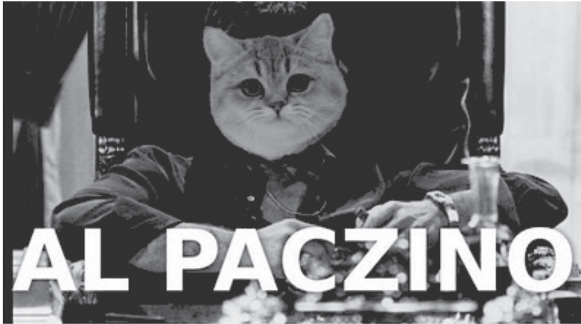
Ilustracja 1. Mem z cyklu Co ja pacze? 7

Zabawy filmowymi tożsamościami są możliwe, ponieważ w XX wieku bywalcy kin doświadczali mocnych wrażeń z dreszczowców, kina grozy, eksponowania kiczu, seksu czy z progresywnych gatunków w rodzaju kina gore . Zakodowane w filmowych tekstach wydarzenia budziły więc pod różnymi szerokościami geograficznymi te same zbiorowe przeżycia, odwoływały się bowiem do globalnej tożsamości emocjonalnego doświadczenia. Technologia zapisu wideo, a potem cyfrowego umożliwiła jednak oglądanie filmu w wybranym przez użytkownika gronie, miejscu, czasie, tempie, z napisami lub lektorem. Ujednolicone konwencje filmowe stały się więc obiektem żartów i gier polegających np. na demonstrowaniu odmiennego punktu widzenia, a wersja językowa zaczęła być dopasowywana do poglądów przewidywanego odbiorcy. Indywidualistyczna kultura konsumpcyjna upowszechniła nowy wzorzec zbiorowej tożsamości: uległa ona fragmentacji na zwolenników różnorodnych tekstów, gier, konwencji i stylów.