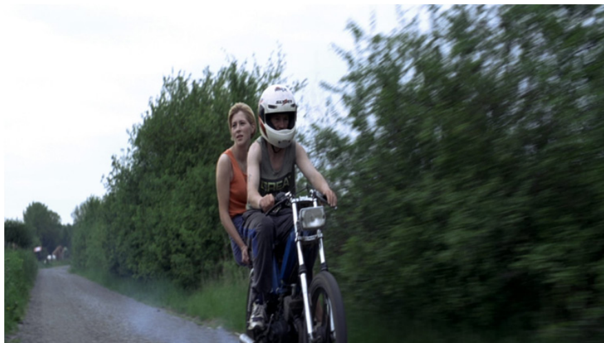
Fot. 2. Pozorna otwartość flandryjskiej prowincji. Kadr z filmu Życie Jezusa Bruno Dumonta (1995)