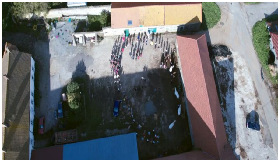
Fot. 3. Wesoła apokalipsa. Kadr z serialu Coincoid i Nieludzie Bruno Dumonta (2018)

Tak jak realizacje Dumonta zdają się oparte na dynamice tego, co lokalne, narodowe i ponadnarodowe, tak i strategia zaangażowania przez reżysera flandryjskich pejzaży i topografii w opowiadane historie ma trzy różne warianty. Pierwszy, najbardziej neutralny, pojawia się w filmach, których całość lub fragmenty – tak jak w przypadku Hadewijch (2009) i Jeanette. Dzieciństwa Joanny d'Arc – były realizowane w tym regionie, lecz nominalnie rzecz biorąc, ich akcja nie została w nich